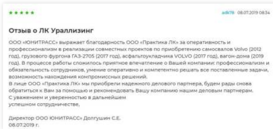
Отзыв на портале www.all-leasing.ru