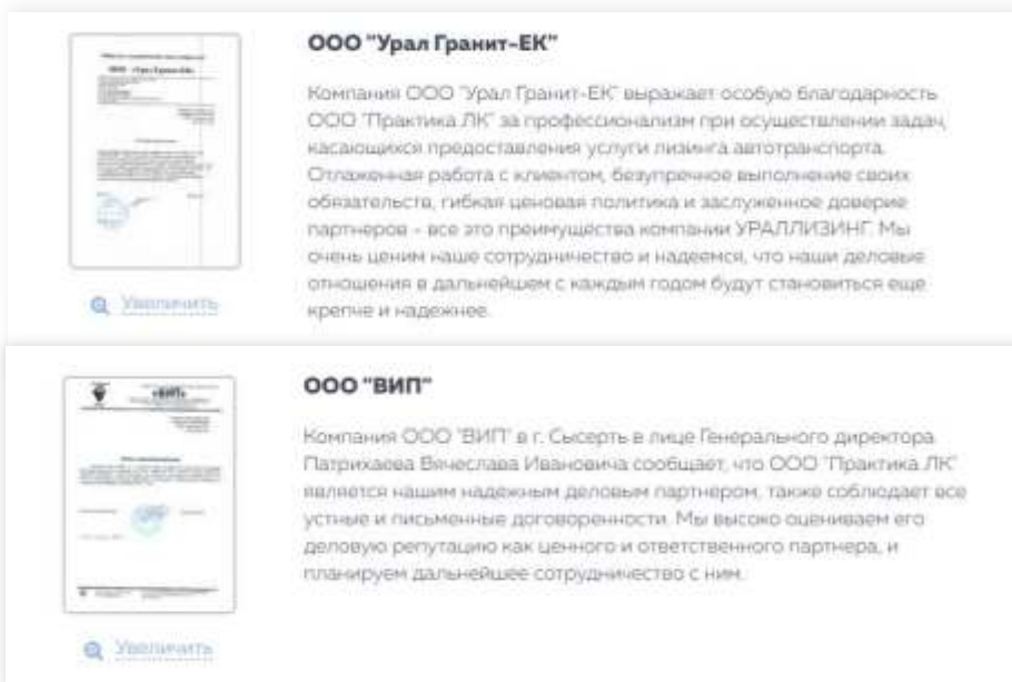
Отзывы на сайте www.urall.ru